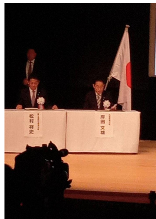
■ 左から松村国土強靱化担当大臣と岸田文雄内閣総理大臣